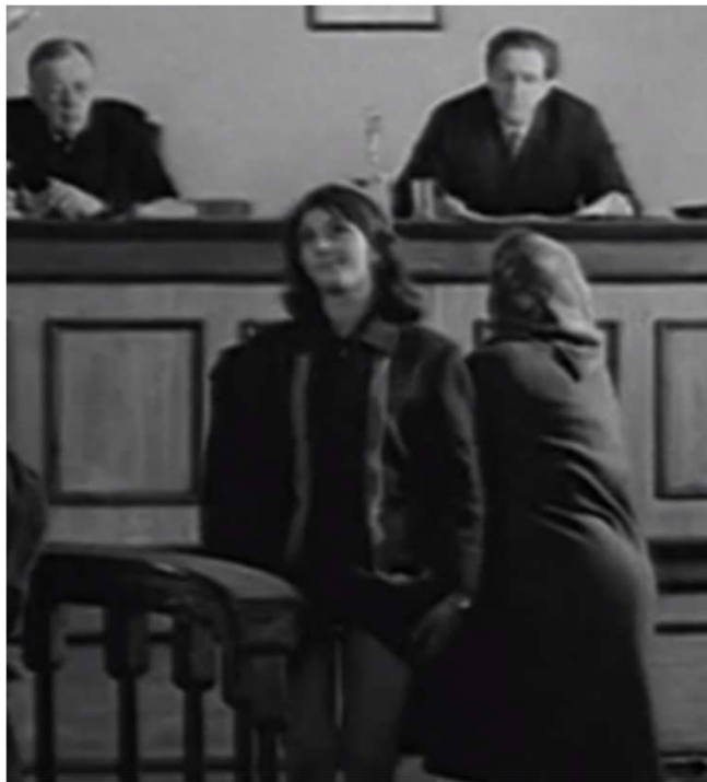
A bíró kételkedett